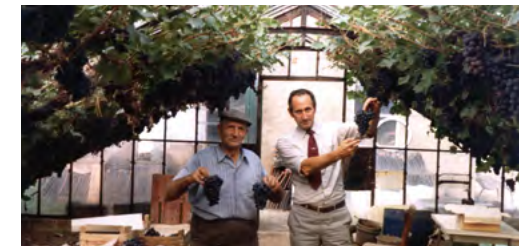
DRUIVENTEELT IN KAS, JAREN '70 VORIGE EEUW

We komen in het Slingerbos; een oorspronkelijk moerasachtig gebied dat pas een eeuw geleden in cultuur werd gebracht en nu als parkje fungeert.