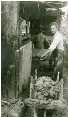
BAKSTEENINDUSTRIE, JAREN '50/'60 VORIGE EEUW

De Angerensche Strang was de hoofdstroom van de Rijn in de 13e/14e eeuw. In het gebied rechts van de strang waren er vanaf 1825 veldovens, daarna enkele ringovens en nu één geautomatiseerde tunneloven. Begin van de 20e eeuw was dit de belangrijkste industriële activiteit. Je werkte toen in de landbouw of op de steenfabriek. Voor de baksteenproductie is er veel klei in de polder gewonnen. Noordelijk van de T-splitsing markeren de rijen wilgen en knotwilgen diverse restgeulen van de Rijn uit de 16e, 17e en 18e eeuw.